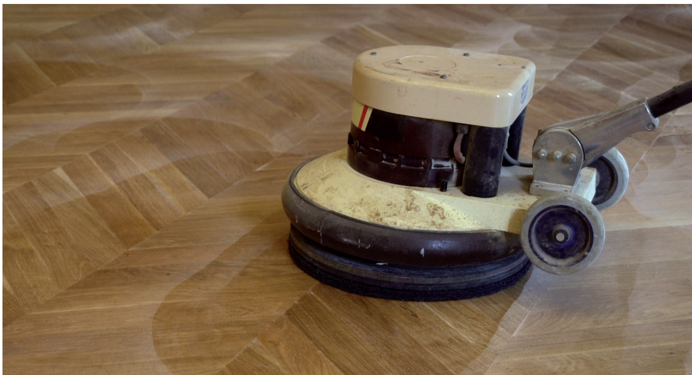
Applicazione su un parquet in legno massiccio – Owatrol Vegafloor –