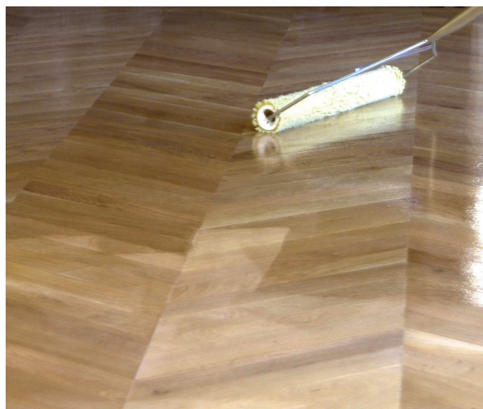
Applicazione su un parquet in legno – Owatrol Vegafloor –