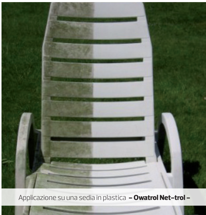
Applicazione su una sedia in plastica - Owatrol Net-trol -