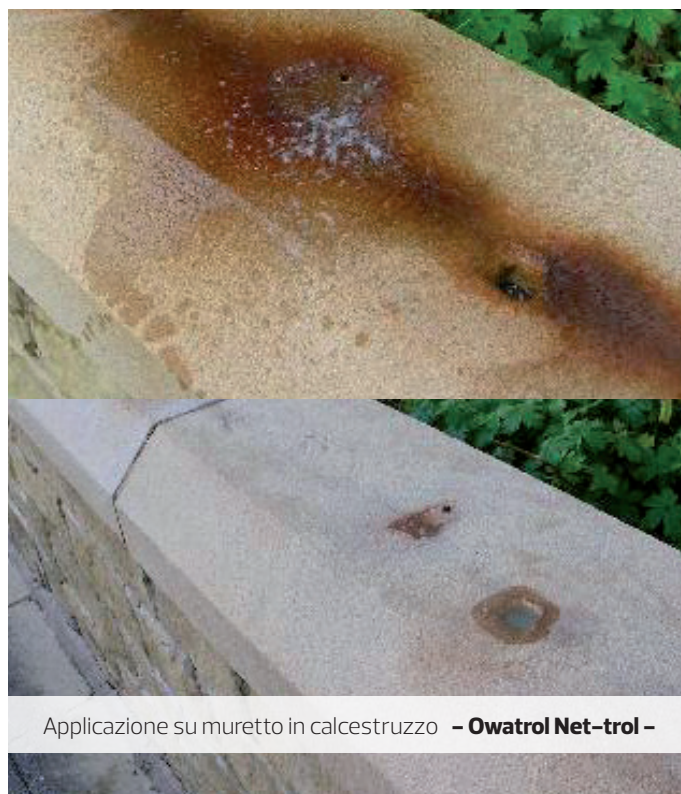
Applicazione su muretto in calcestruzzo - Owatrol Net-trol -

● Tenere fuori dalla portata dei bambini. Fare riferimento alle istruzioni sulla latta. Scheda di sicurezza disponibile su www.owatrol.it .